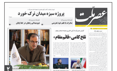
در جشنواره رسانه ها؛