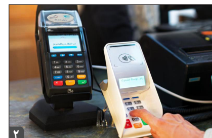
مدیر کل امور مالیاتی زنجان؛

عصرمَلّت - مسئولان می گویند، در راستای کاهش آمار زایمان سزارین؛ خدمات زایمان طبیعی در بیمارستانهای استان افزایش یافته است و یکی از برنامه های طرح تحول سلامت در دولت یازدهم و دوازدهم ترویج فرهنگ فرزندآوری است که بر این اساس وزارت بهداشت، درمان و آموزش پزشکی ترویج زایمان طبیعی با خدمات بهتر و کاهش مرگ و میر نوزادان و مادران حین زایمان و