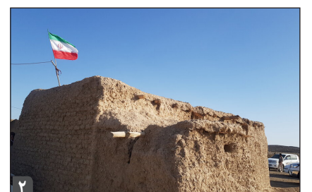
مدیرکل آموزش و پرورش زنجان؛