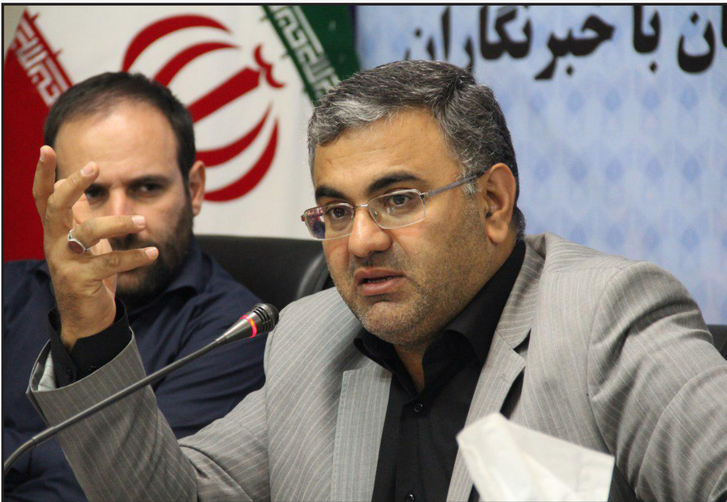
رئیس دانشگاه آزاد اسلامی زنجان؛