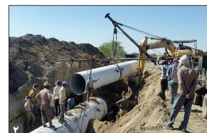
جانشین فرماندهی سپاه استان زنجان:

افتتاح و کلنگ زنی یک هزار ۷۵۱ طرح در دهه فجر