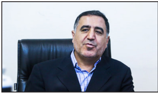
روایت محبی‌نیا از گیر و دار مجلس؛