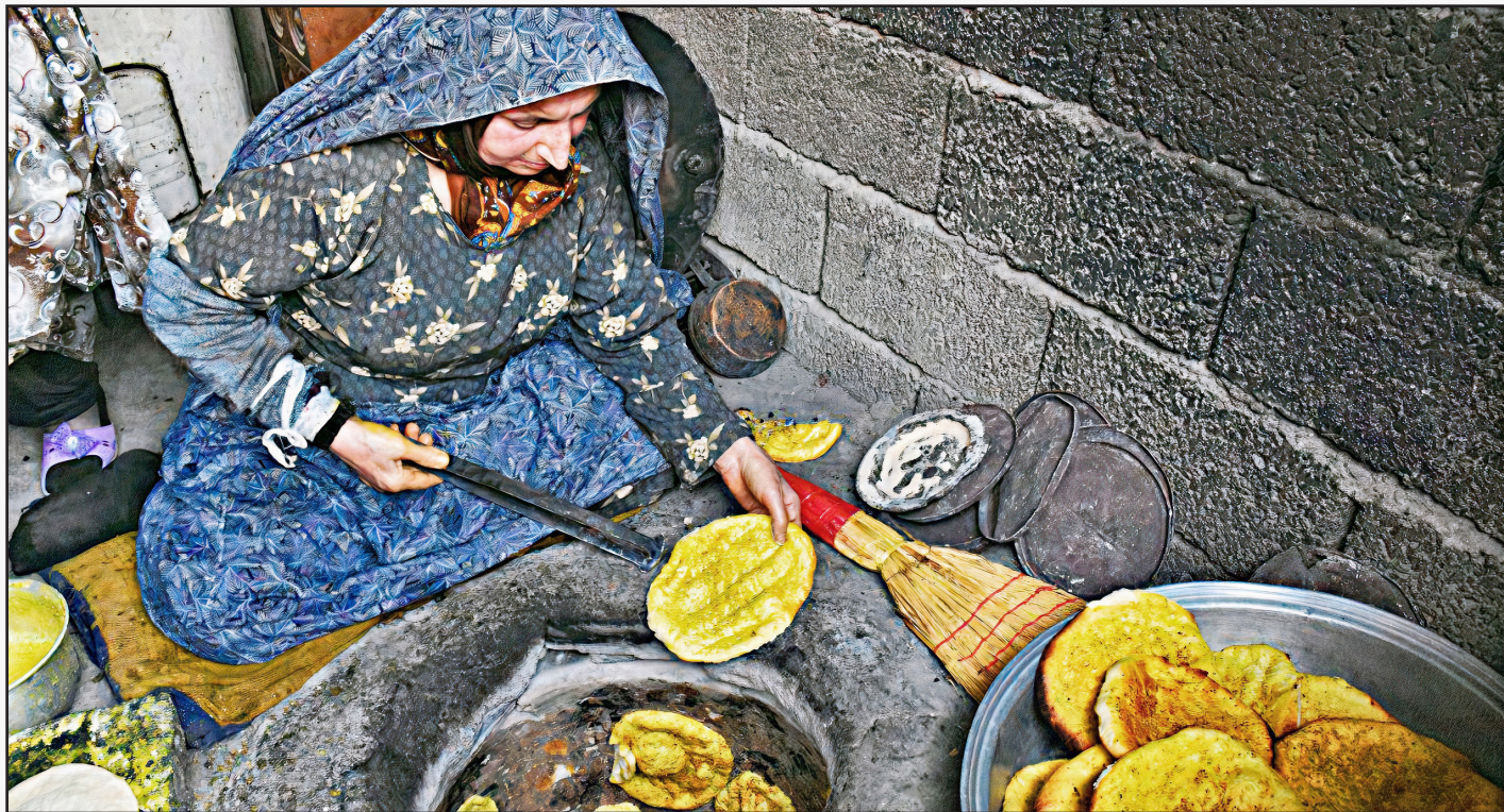
عصر ملت گزارش می دهد؛