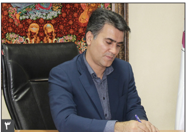
همزمان با دهه فجر؛

عصر ملت - استاندار زنجان با تاکید بر اینکه در انتصاب مدیران و فرمانداران جدید زیر فشار نخواهم بود، گفت: بیشتر این تغییرات مبتنی بر توسعه روند پیشرفت استان خواهد بود که در این راه اصلاح امور مهم است. فتحالله حقیقی در نخستین نشست رسمی خبری با اصحاب رسانه با اعلام اینکه تغییر فرمانداران در پیش است، افزود: اگر فرمانداران نتوانند با برنامه های ما کنار بیایند، کنار می روند و امید داریم بتوانیم فرمانداران را با برنامه های خود برای پیشبرد امور همگام سازیم.