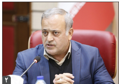
رئیس کمیسیون اصل ۹۰ مجلس؛

سیستم بانکی کشور ۱۳۰ هزار میلیارد تومان معوقه دارد بهره برداری از ۹ پروژه در شهرک های صنعتی زنجان