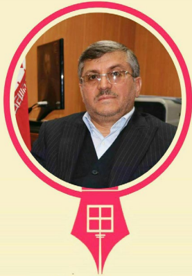
روز خبرنگار مبارک ۱۷ مرداد

با سلام و درود به روح بلند و پاک شهدای عرصه خبر