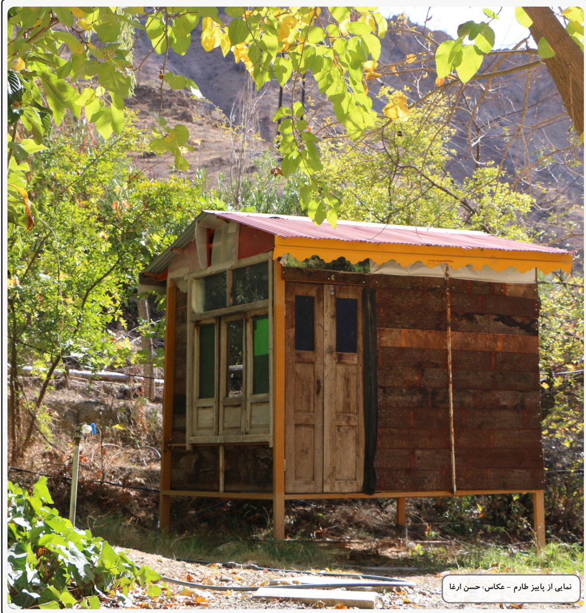
نمایی از پاییز طارم

فراز و فرود مطبوعات زنجان در گفت و گو با حسن حسینیعلی: